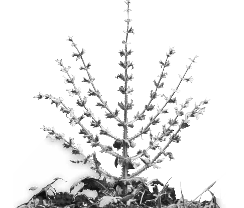
© כל הזכויות שמורות 2005, לנאות קדומים, תא דואר 1007 לוד 71110

נעדך ונכתב מחדש על ידי נילי הרשגל ונגה הראובני עיצוב: דורית דאון.